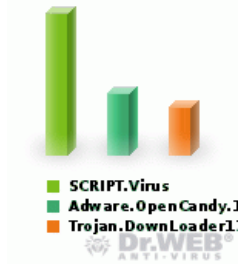
СТАТИСТИКА ОБНАРУЖЕНИЯ ВИРУСОВ